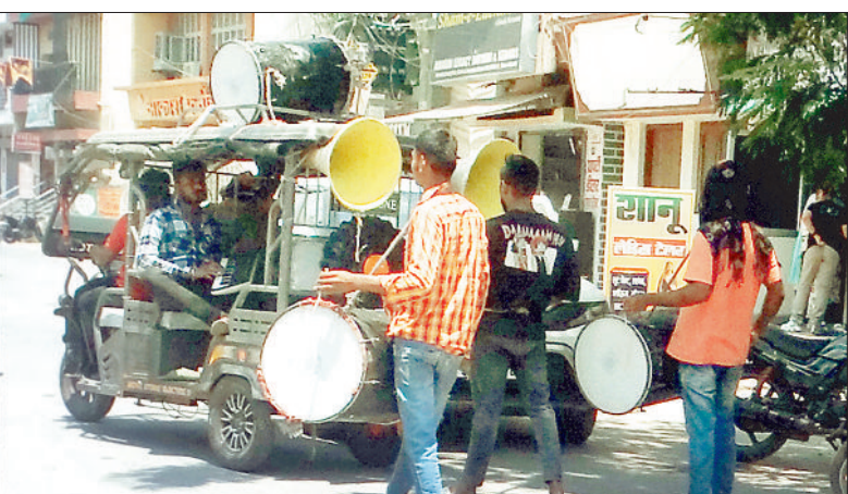
रिविहार की दोपहर ढोल ताशे के साथ चुनाव प्रचार किया जाता रहा।

जिला निर्वाचन अधिकारी ने बताया कि जिले के मतदान केंद्रों के लिए मतदान दलों को सामग्री वितरित करने के लिए 16 कांटेक्टर बनाए गए हैं, जिनमें 300 कर्मचारियों की इयूटी लगाई गई है। मतदान दलों को सामग्री वितरण का कार्य 6 मई सोमवार को कोनी स्थित शासकीय इंजीनियरिंग कॉलेज परिसर से सुबह 7 बजे से शुरू होगा। इसमें कोटा विधानसभा क्षेत्र के लिए 10 कांटेक्टर, तखतपुर विधानसभा क्षेत्र के लिए 14, बिल्हा विधानसभा क्षेत्र के लिए 10, बिलासपुर विधानसभा क्षेत्र के लिए 12, बेलतरा विधानसभा क्षेत्र के लिए 13 और मस्तूरी विधानसभा क्षेत्र के लिए 17 कांटेक्टर बनाए गए हैं।