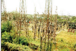
मॉन्टनेस पर उठ रहे सवाल

कोरबा से जनरेशन की सप्लाई बंद होने के बाद शहर में करीब 1 घंटे तक बिजली बंद रही, अचानक पाँवर ग्रिड 220 केवी की सप्लाई बंद होने से शहर के 4 बड़े सबस्टेशन में सप्लाई ठप हो गई। इस दौरान शहर के साथ ही आसपास के ग्रामीण क्षेत्रों में बिजली बंद रही। अधिकारियों के अनुसार पौन घंटे में सप्लाई नार्मल कर दी गई थी, लेकिन हकीकत में अलग-अलग फीडर से सप्लाई पूरी तरह से नार्मल करने में समय लगा। वहीं पारा 43 डिग्री के करीब होने के कारण उपभोक्ताओं का हाल बेहाल रहा।