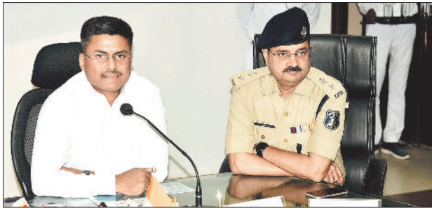
मतदान केंद्रों में चाक चौबंद व्यवस्था

कलेक्टर और जिला निर्वाचन अधिकारी अरुण शरण ने प्रचार वार्ता में बताया कि सुरक्षा बलों के सशस्त्र जवानों को बिलासपुर लोकसभा क्षेत्र के 6 विधानसभा के संवेदनशील मतदान केंद्रों में तैनात किया जाएगा, ताकि कहीं भी अप्रिय स्थिति न बने। फिलहाल सभी जिलों को शहर के सिविल लाइन, तोखा, सरकड़ा, सकरी, चकरभाटा, कोनी स्थित स्टूडिंग रूम के साथ ही तखतपुर, कोटा, रतनपुर, सीपत, मल्हार, पंचपेड़ी, बिल्हा और सरकारी भवनों में ठहराया गया है।