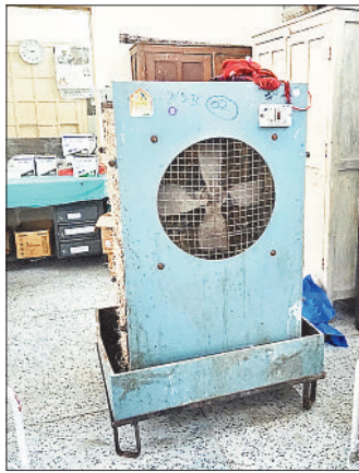
वार्ड का बंद कूलर।

स्टाफ की कमी, व्यवस्था तक नहीं संभाग के सबसे बड़े अस्पताल में 8 से अधिक मरीज भर्ती रहते हैं, लेकिन इन मरीजों को सही इलाज देने में प्रबंधन फेल हो जा रहा है। खास बात यह है कि सिस्स के पास पर्याप्त स्टॉफ नहीं है। जिसके चलते लाखों करोड़ों रुपए खर्च करने के बाद भी मरीजों को सतुल्य नहीं मिल रही है। कूलर में पानी डालने के लिए स्टॉफ नहीं है, वहीं जहां स्टॉफ मौजूद है, वहां व्यवस्था नहीं है। ऐसे में मरीजों का खासी दिक्कतों का सामना करना पड़