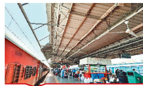
रेलवे स्टेशन के प्लेटफार्म नंबर 4 का आंधी से टूटा शोड आज तक नहीं बन पाया।

बिल्हा | मस्तूरी | तखतपुर | मुंगेली | कोटा | लोरमी | सरगांव | पेंड़ा | रतनपुर | पथरिया